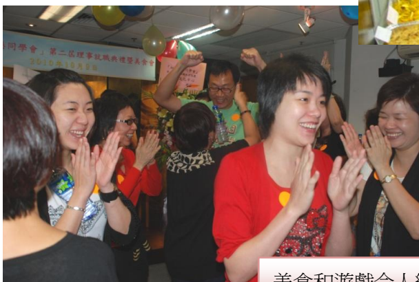
美食和遊戲令人樂透

笑容，互相拍照留念，並對同學們準備的美食讚不絕口。享用過美食後，是遊戲時間，大家分組