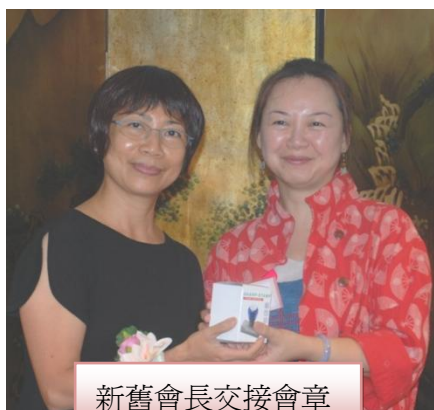
新舊會長交接會章

「好開心能跟中心同學在一起，幫助到有需要的同學，過去一年即使有開心或不開心，或其他困難，我都覺得好感動，因為這使我們成長，也將我們的心箍緊！」台下即報以熱烈掌聲。